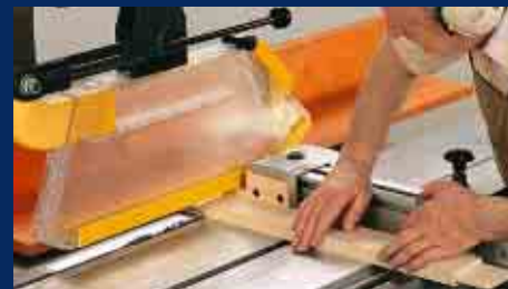
Schutzeinrichtungen und Handhaltung beim Absetzen von Zapfen