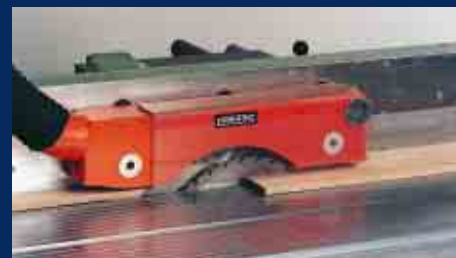
Sägen von Werkstücken mit dem Vorschubapparat