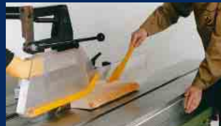
Sägen schmaler Werkstücke mit Schiebstock