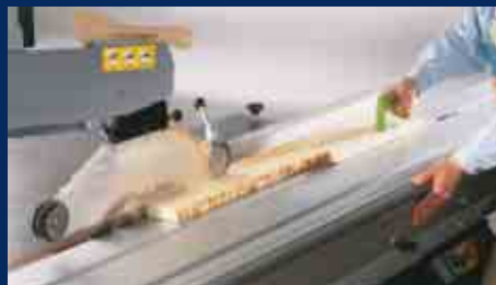
Sägen von Leisten mit Schiebholz