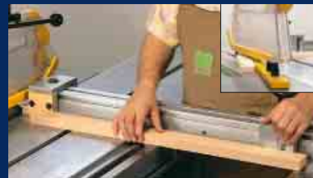
Ablängen schmaler Werkstücke mit Queranschlag