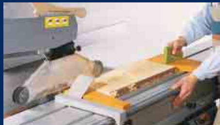
Vorrichtung und Handhaltung beim Besäumen