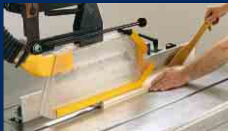
Schutzeinrichtungen und Handhaltung beim Fälzen