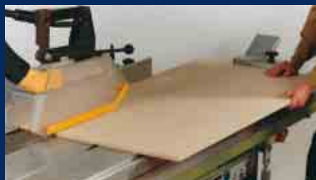
Schutzeinrichtungen und Handhaltung beim Einsetzsägen